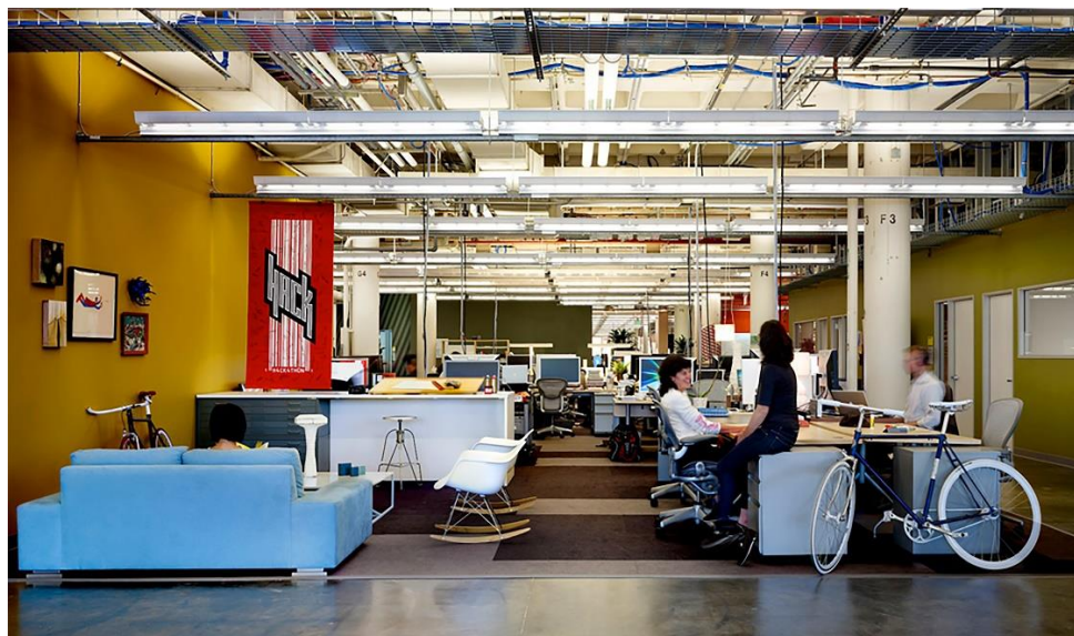
Рис. 5. Главный офис компании Facebook, Пало-Альто, Калифорния. Проектные студии Studio O+A, Virginie Manichon, KPFF – Consulting Engineers, Air Systems Inc., Elcor Electric и Brightworks.

Изучив основные аспекты гибкого офиса и коворкинга, можно с уверенностью сказать, что эти принципы формирования офисного пространства действительно являются наиболее эффективными и продуктивными, но подходят далеко не всем