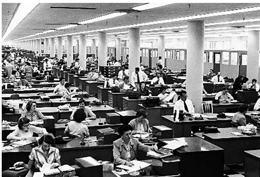
Рис. 2. Планировочное решение офиса Фредерика Тейлора.