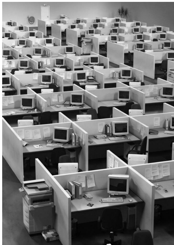
Рис. 3. Планировка и внешний вид Action Office (кубиклы)

В ходе различных трансформаций офисного пространства возник комбинированный тип планировки. Он сочетает в себе преимущества двух предыдущих планировочных решений, тем самым нивелируя их недостатки, и имеет более сложную структуру. Этот тип планировки стал популярен в 1990-х годах в Западной Европе, а конкретно в Австрии, Германии, Голландии и Скандинавских странах. В ходе изучения примеров данного пространства было выявлено, что в нём учитываются как требования, касающиеся частного пространства, так и потребности в гибкости и коммуникациях. Реализуется это путем грамотного зонирования, разделения зон на общие, групповые и индивидуальные с помощью различных конструкций и мебели, к примеру – прозрачных перегородок [1].