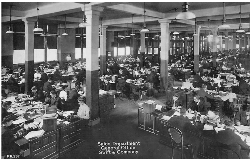
Рис. 1. Открытая планировка отдела продаж компании Swift & Co в Чикаго, штат Иллинойс, 1910 г.

К главным преимуществам этой схемы формирования рабочего пространства можно отнести: быстрый обмен информацией, общение между сотрудниками и обмен опытом, высокий уровень командной работы, легкость ремонтных работ и изменения планировки. Выделенными в ходе исследования недостатками этой системы будут являться невозможность уединения, отсутствие своего личного рабочего пространства и проблемы с шумоизоляцией.